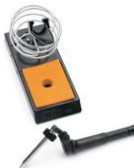
LT Lötspitzen: siehe Seite 87 / 88