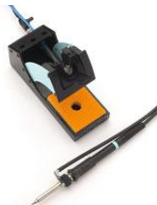
LT Lötspitzen: siehe Seite 87 / 88